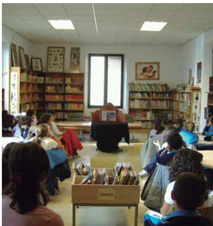
La FEMP quiere que se reconozca el inestimable papel de las bibliotecas municipales en el fomento de la lectura.

Desde la Federación se alude, además, a la participación de estos centros en las Campañas de Animación a la Lectura María Moliner que, en su última edición, concitó 609 proyectos elaborados y rea-