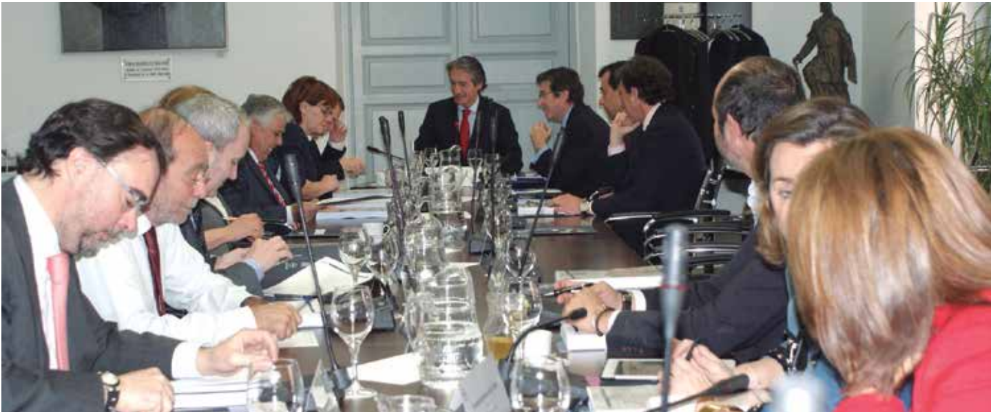
La última Junta de Gobierno ordinaria se celebró el 24 de marzo

Con todo ello, los participantes en el Pleno podrán serlo en calidad de delegados, observadores afiliados y observadores no afiliados. Los primeros acuden con voz y voto en representación de socios titulares. Los segundos, con voz pero sin voto, son miembros de Entidades Locales asociadas a la FEMP o también representantes de Federaciones Territoriales de Entidades Locales de ámbito autonómico asociadas a la FEMP. En cuanto a los terceros, que no tienen voz ni voto, son aquéllos que representan a Corporaciones Locales no asociadas, o de Federaciones de Entidades Locales de ámbito autonómico no vinculadas a la FEMP. ★